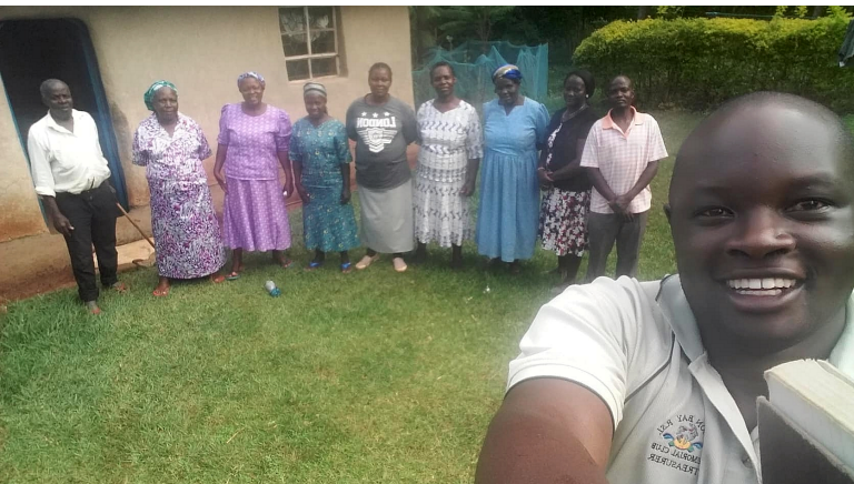
Jethron und die Asundi Self Help Group