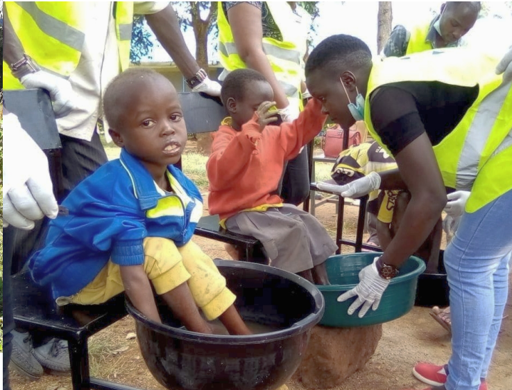
Kinder bei der Jiggerbehandlung

Sandflöhe (sog. „Jigger“) sind im Boden lebende Parasiten, die in die Haut der Füße eindringen und Entzündungen verursachen. Mit Hilfe von Spendengeldern konnten ca. 100 Mitglieder der Dorfgemeinschaft, vor allem Kinder und ältere Personen, medizinisch behandelt werden.