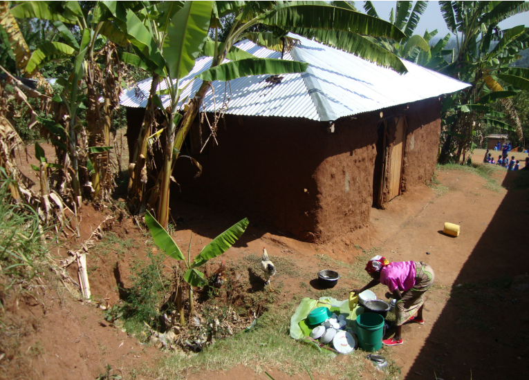
Die neu errichtete Schulküche

Mit Hilfe von Spenden wurden die desolate Schulküche und die Toilettenanlagen der Dorfschule neu errichtet und zusätzliche Schulbänke angekauft. Zusätzlich wurde die Abschlussklasse ein Jahr lang täglich mit einer Mittagsmahlzeit versorgt.